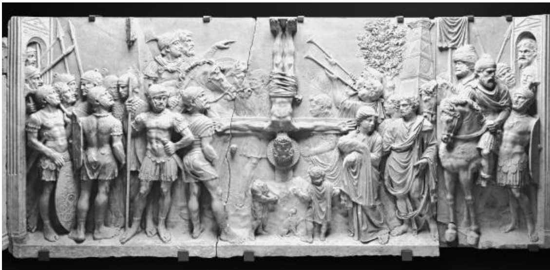
Figura 3 – exemplo de gruppo scultorico – (em escala de cinza) – “A Crucificação de São Pedro” do Cibório de Sixto IV, de Paolo Romano.