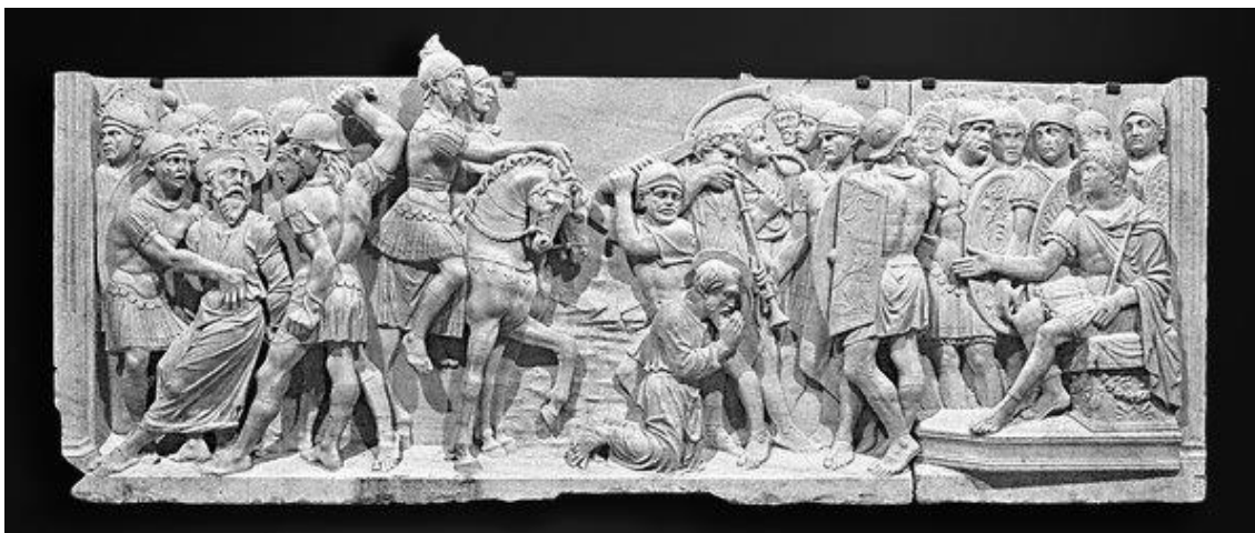
Figura 2 – exemplo de gruppo scultorico – (em escala de cinza) - “Martírio de São Paulo” do Cibório de Sixto IV - (1471 – 1484) de Paolo Romano (1415 – 1470), feito de resina e pó de mármore, original do século XV. Disponível em http://arsmediaevalis.com.br/2012/09/20/exposicao-esplendores-do-vaticano-comeca-nesta-sexta-feira-em-sao-paulo/ , ou em http://guia.uol.com.br/album/2012/09/20/veja-itens-da-exposicao-esplendores-do-vaticano-em-sao-paulo.htm#fotoNav=14 , e também disponível em http://www.acatolica.com/2013/01/e-o-vaticano-continua-entre-nos.html , acessados em 09 mar 2014.

Exemplos de gruppo scultorico , a partir da mostra “Esplendores do Vaticano”, vista no Brasil em 2013: